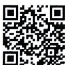
QR Code วิธีการปฏิบัติฯ เอกสารที่เกี่ยวข้อง